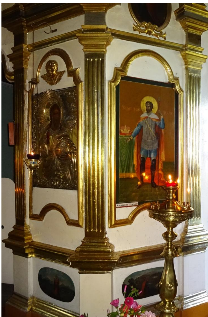
Неугасимая лампада у образа Александра Невского

Воспитание детей – одна из основных проблем современного общества. Эта проблема сейчас находится в приоритете у большинства ученых и педагогов.