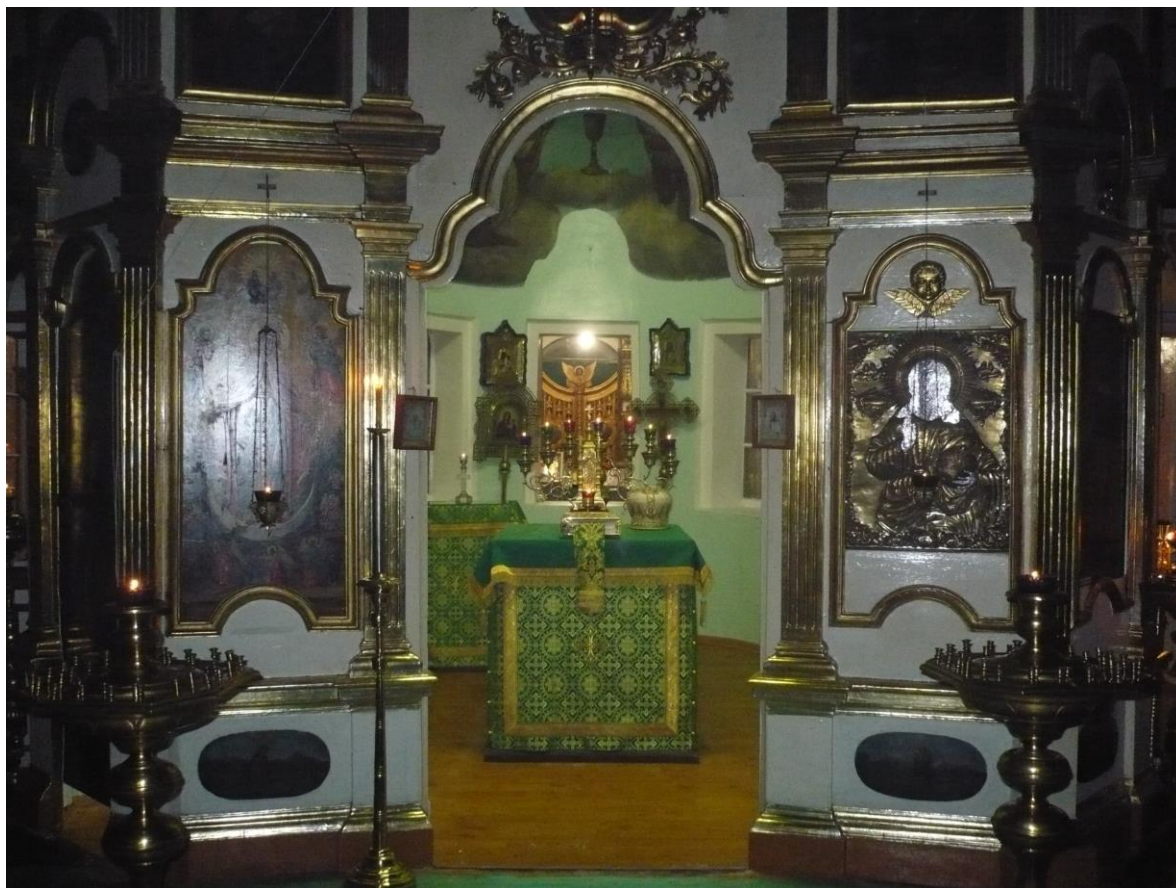
Престол Александра Невского

Уникальность храма состоит в том, что сама церковь была построена в 1735 году, затем, в конце 30-х годов 18 века, внутри трапезной был построен придел Александра Невского. Получается, в храме два престола. Именно поэтому дата- 800-летие со дня рождения Александра Невского нам очень близка.